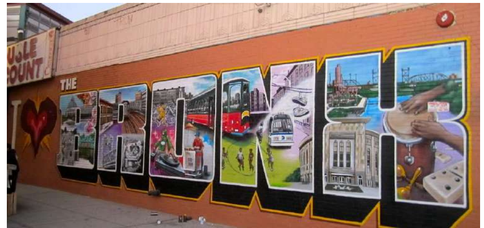
Bronx foto di French District

Premetto che non sono stata a visitare il Bronx dato che ancora oggi viene descritto come un quartiere pericoloso; nonostante la sua fama, il Bronx vanta molte attrattive e luoghi d'interesse: possiede molti parchi tra cui il Bronx Zoo , il più vasto degli Stati Uniti. Interessante anche il Botanical Garden che si estende per circa 100 ettari, con più di 200 varietà di rose e più di 15 ettari di foresta. Inoltre si può visitare la zona di Belmont , l' Edgar Allan Poe Cottage e i giardini di Wave Hill .