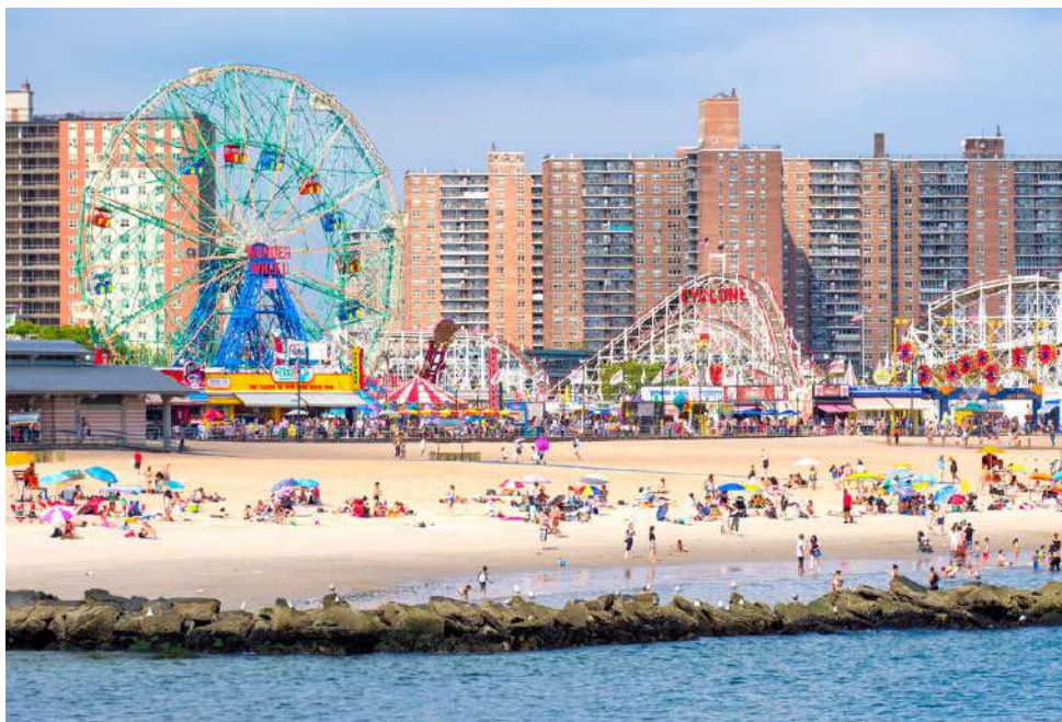
Coney Island

splendori del passato, ma sull'isola sono presenti soprattutto centinaia di venditori di souvenir e piccoli stabilimenti stagionali.